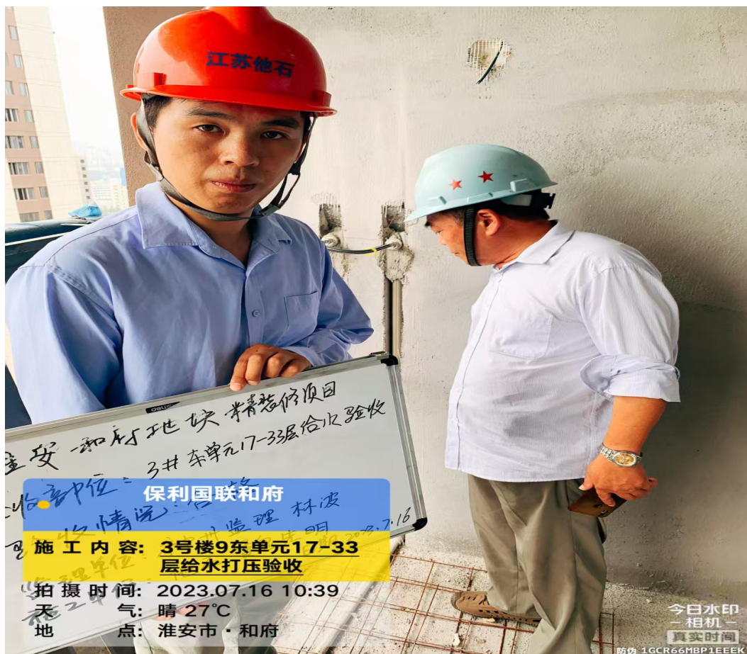
现场放线、给排水管预埋、压力试验