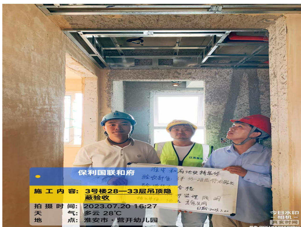
吊顶施工、隐蔽验收