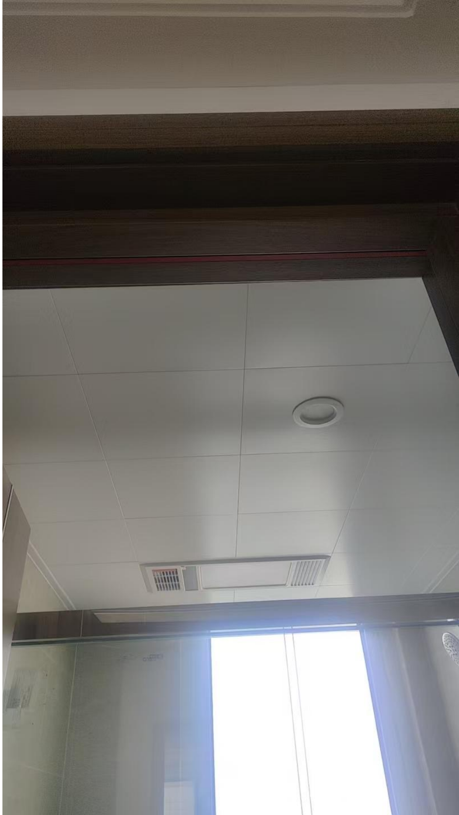
卫生间洁具、淋浴屏安装