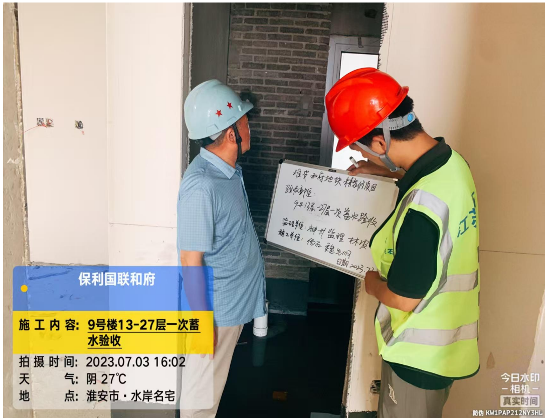
防水施工、蓄水试验