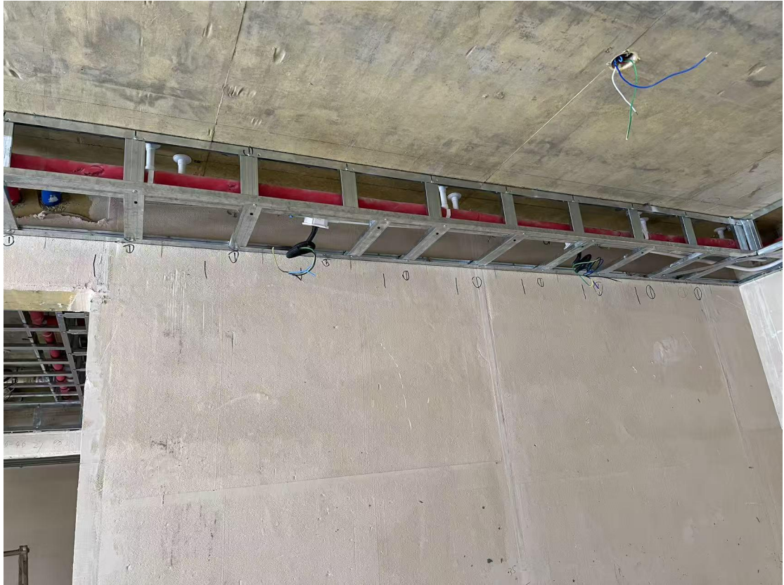
强弱电管、新排风管线布排施工